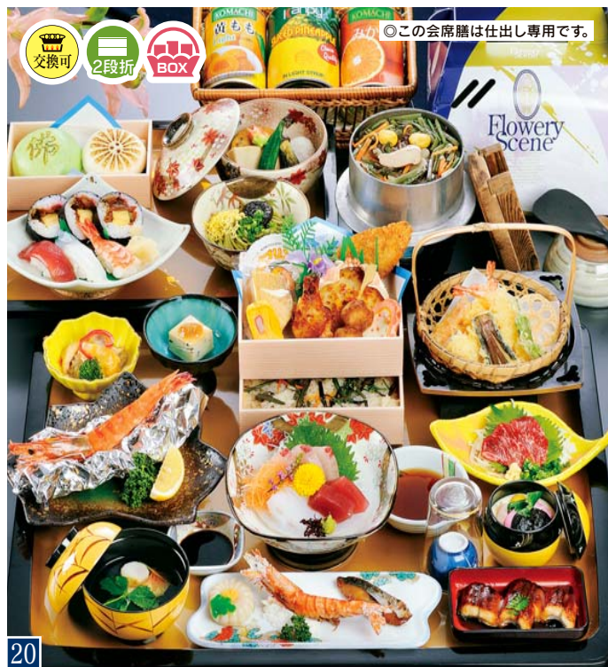
20 仏事用会席膳 (詰合せボックス・釜飯付) 本体価格 5,600円 (税別) <6,048円 (税込)>