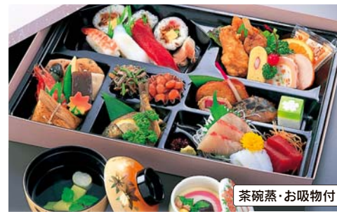
73 幕盛會席 (縦/31cm・横/44cm) 本体価格 3,600円 (税別) <3,888円 (税込)>