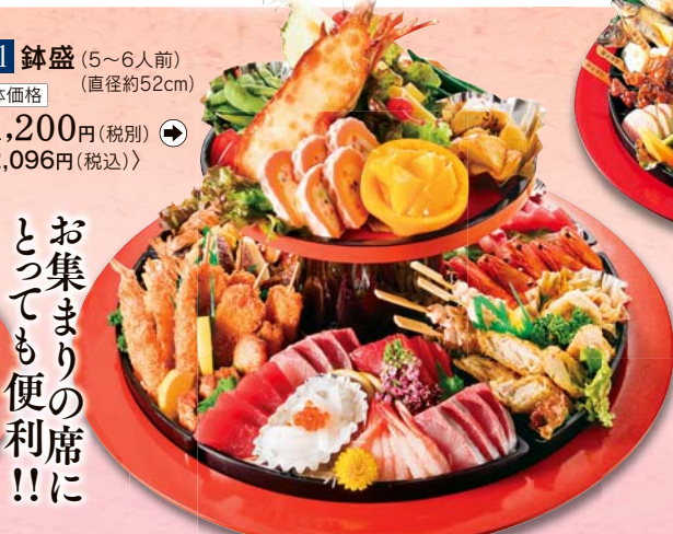
131 鉢盛 (5~6人前) (直径約52cm) 本体価格 11,200円 (税別) <12,096円 (税込)>