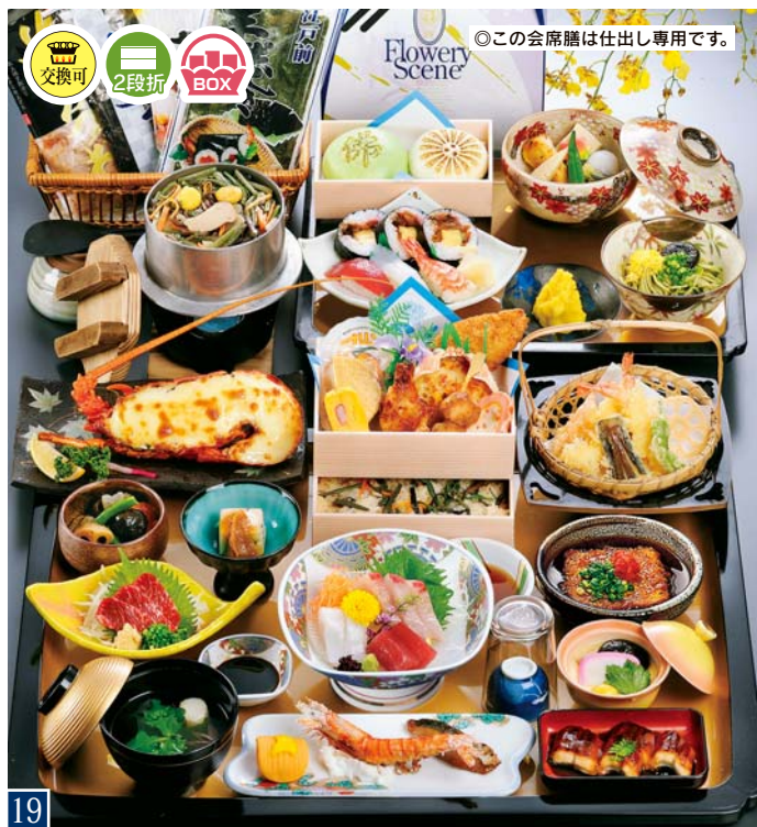
19 仏事用会席膳 (詰合せボックス・釜飯付) 本体価格 7,200円 (税別) <7,776円 (税込)>