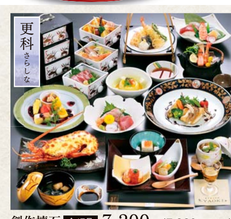
創作懐石 全17品 7,200円 <7,920円 (税込)>

心に響く、おもてなし空間と味わい Y A O K I 完全予約 完全個室 全室掘ごたつ完備