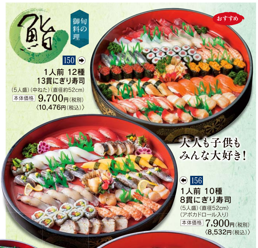
150 御旬料理 1人前 12種 13貫にぎり寿司 (5人盛) (中ねた) (直径約52cm) 本体価格 9,700円 (税別) <10,476円 (税込)>