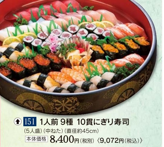
151 1人前 9種 10貫にぎり寿司 (5人盛) (中ねた) (直径約45cm) 本体価格 8,400円 (税別) <9,072円 (税込)>