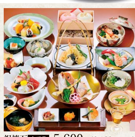
祝懐石 全17品 5,600円 <6,160円 (税込)>