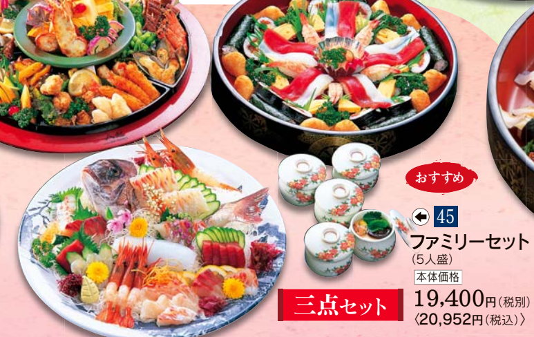
45 ファミリーセット (5人盛) 本体価格 19,400円 (税別) <20,952円 (税込)>