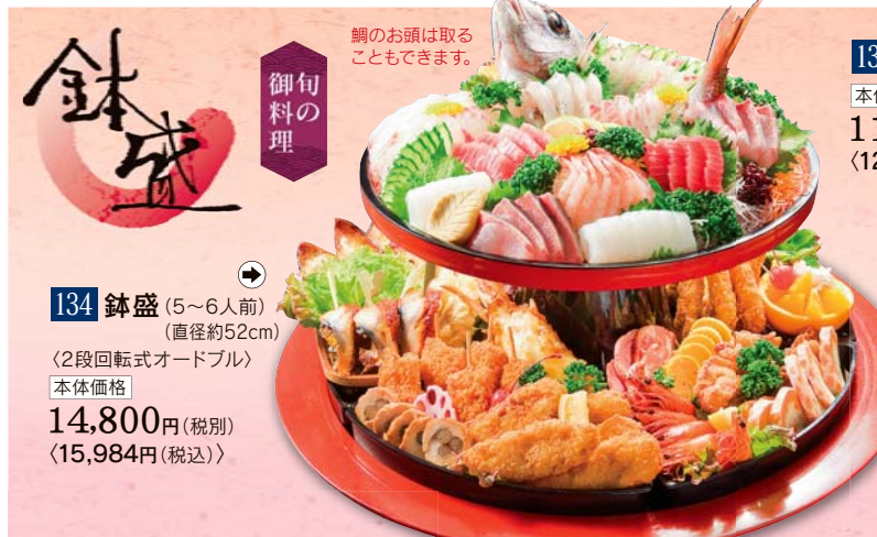
134 鉢盛 (5~6人前) (直径約52cm) <2段回転式オードブル> 本体価格 14,800円 (税別) <15,984円 (税込)>