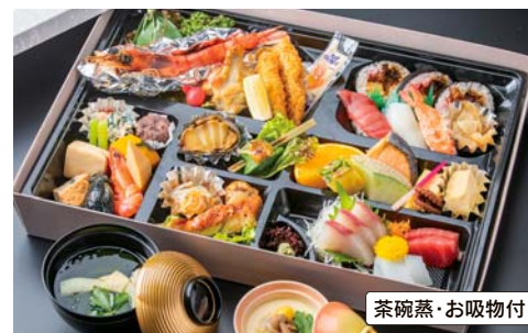
77 幕盛會席 (縦/31cm・横/44cm) 本体価格 4,100円 (税別) <4,428円 (税込)>