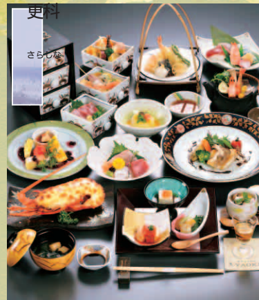
創作懐石 (全17品) 6,000円 6,600円(税込)