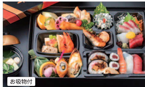
83 幕の内弁当 (縦 / 27 cm 横 / 37.5 cm) 本体価格 2,500円(税別) 2,700円(税込)