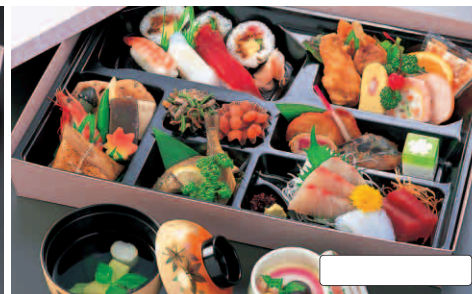
73 幕盛会席 (縦 / 31 cm 横 / 44 cm) 本体価格 3,000円(税別) 3,240円(税込)