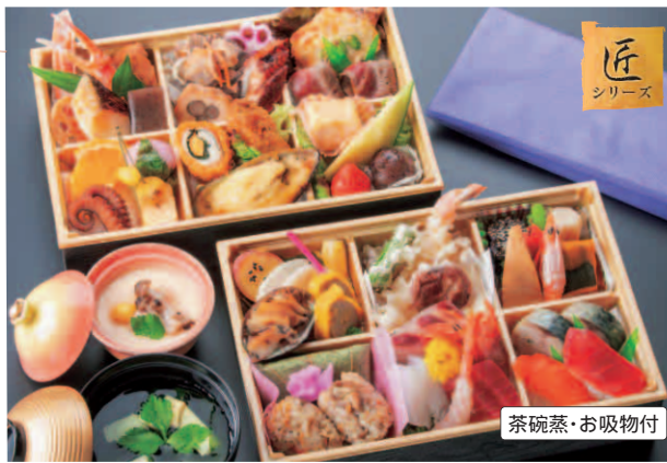
86 二段幕の内会席 匠・松 (縦 / 18 cm・横 / 27 cm 2段) 本体価格 5,000円(税別) 5,400円(税込)