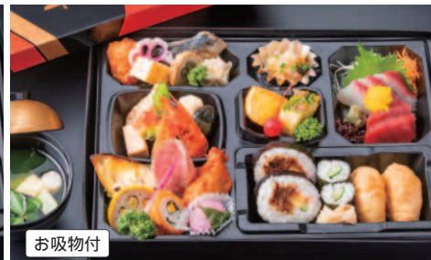
84 幕の内弁当 (縦 / 25 cm 横 / 34.5 cm) 本体価格 2,000円(税別) 2,160円(税込)