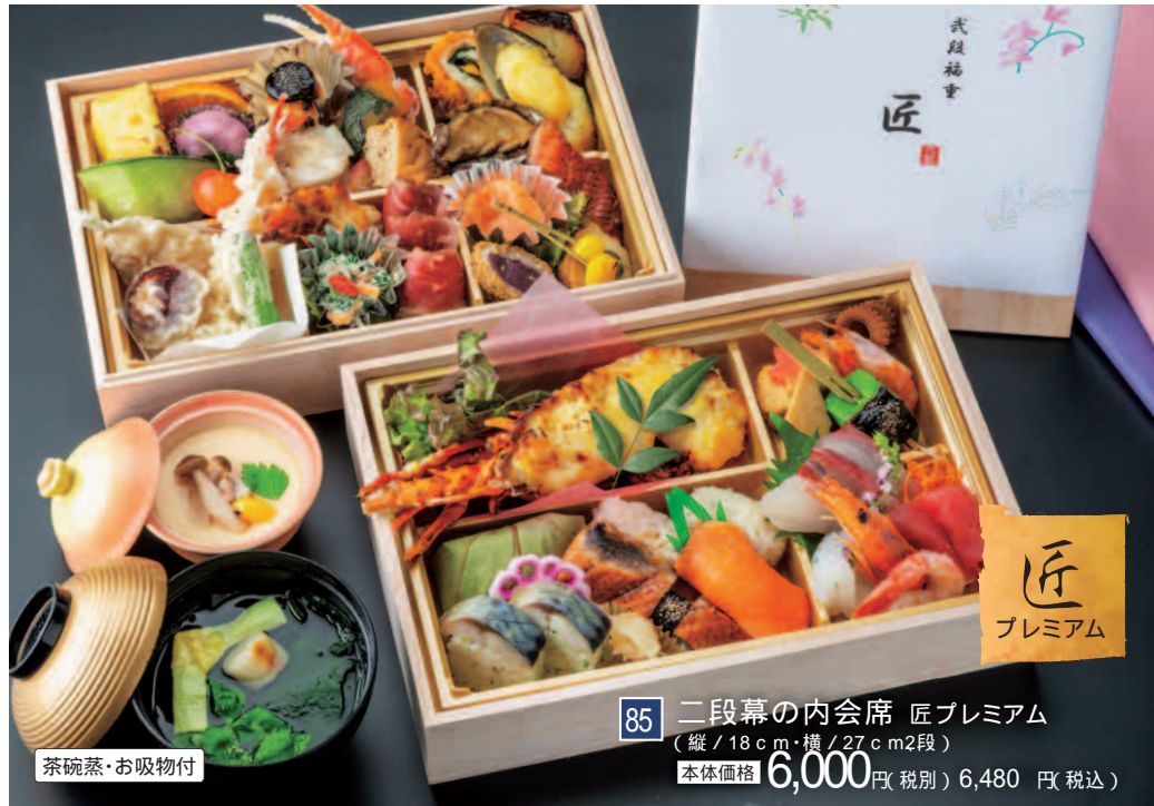
85 二段幕の内会席 匠プレミアム (縦 / 18 cm・横 / 27 cm 2段) 本体価格 6,000円(税別) 6,480円(税込)