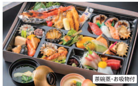
77 幕盛会席 (縦 / 31 cm 横 / 44 cm) 本体価格 3,500円(税別) 3,780円(税込)