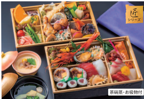
87 二段幕の内会席 匠・竹 (縦 / 18 cm・横 / 27 cm 2段) 本体価格 4,500円(税別) 4,860円(税込)