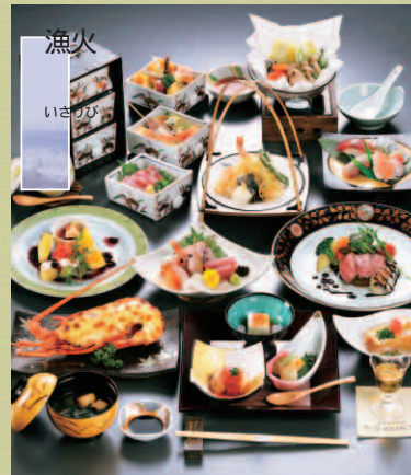
創作懐石 (全17品) 7,000円 7,700円(税込)