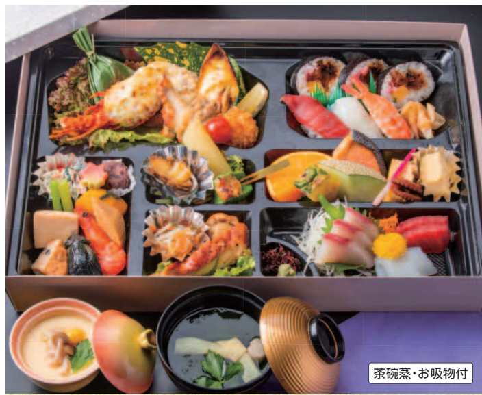
71 幕盛会席 (縦 / 31 cm 横 / 44 cm) 本体価格 4,000円(税別) 4,320円(税込)