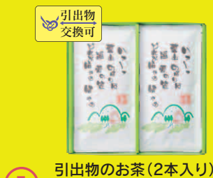
引出物のお茶(2本入り)